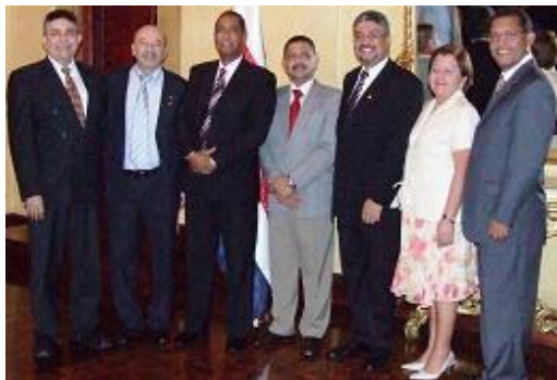
Directorio Ejecutivo de la CCC-CA

El 16 de septiembre celebraron su 3ª Reunión del año en Costa Rica, dando seguimiento al Plan Anual Operativo (PAO) 2010 y a las actividades del 30º aniversario. Consideró aspectos protocolarios que deben conocer la[os] directivos para una gestión apropiada y las propuestas para la acción y fortalecimiento de los Comités Nacionales de Afiliadas, a concretarse en 2011.