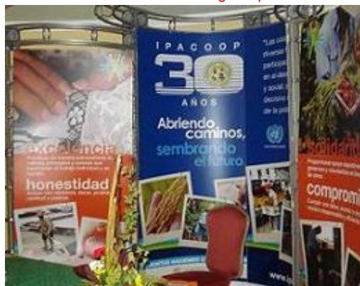
2010 fue el año del 30° Aniversario del Ipacoop, por lo que se brindó una exposición sobre su acción