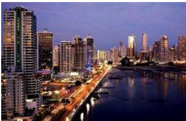
La vibrante Ciudad de Panamá fue la sede de la Conferencia sobre el Rol del Cooperativismo

De gran relevancia fue ver las perspectivas del cooperativismo en la coyuntura post-crisis y en un nuevo orden económico y social, visualizando su rol como polo de desarrollo local en previsión de posibles crisis futuras.