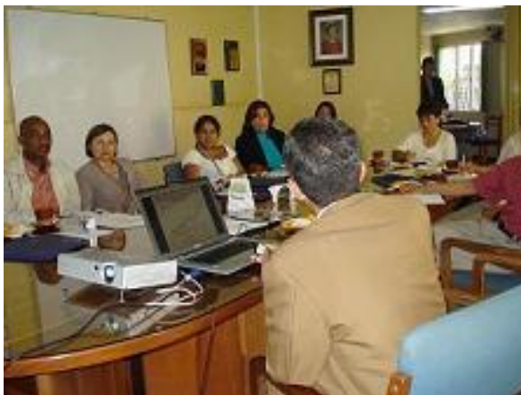
Vista parcial de la distinguida delegación ecuatoriana