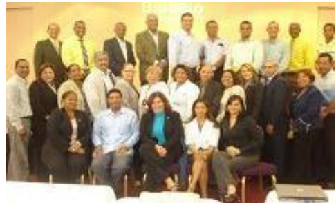
Taller Nacional en República Dominicana