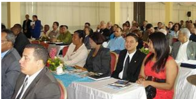
Las delegaciones participaron en amplio diálogo luego de recibir las exposiciones y presentaciones de paneles especializados