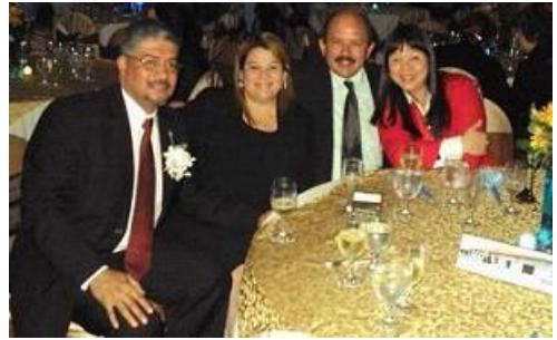
Momentos de la celebración de cierre del 40° aniversario de Coopemep en diciembre pasado