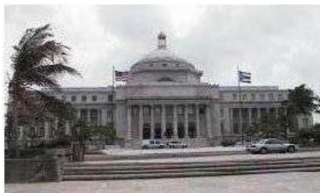
El Capitolio (Asamblea Legislativa)

En la tarde el encuentro fue con la Cooperativa Gasolinera y Servicios Buena Vista y la Cooperativa A/C Vega Alta.