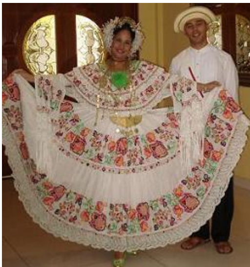
El apoyo de Ipacoop y afiliadas fue claro. Los ujieres nos recibieron luciendo sus galas panameñas

Las y los participantes de la Conferencia aprobaron una Declaración sobre la situación entre Costa Rica y Nicaragua, denotando el interés, vocación e internacionalismo del cooperativismo, llamando a concretar con acciones reales la integración y el desarrollo para nuestros pueblos, unidos en sus bases.