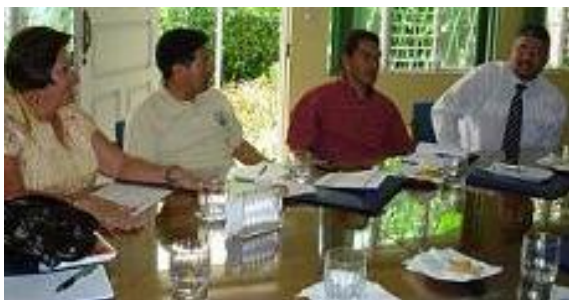
La dirigencia de la CCC-CA en Costa Rica compartió con sus compañeros y compañeras del Ecuador