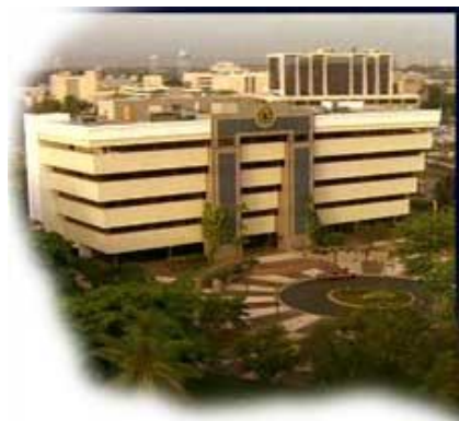
Cooperativa de Seguros Múltiples

El primer día se dedicó al intercambio con las organizaciones centrales: la Liga de Cooperativas, la Cooperativa de Seguros de Vida (Cosvi), el Banco Cooperativo (Bancoop) y la Cooperativa de Seguros Múltiples.